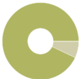
Scope 2 Market-based energiförbrukning